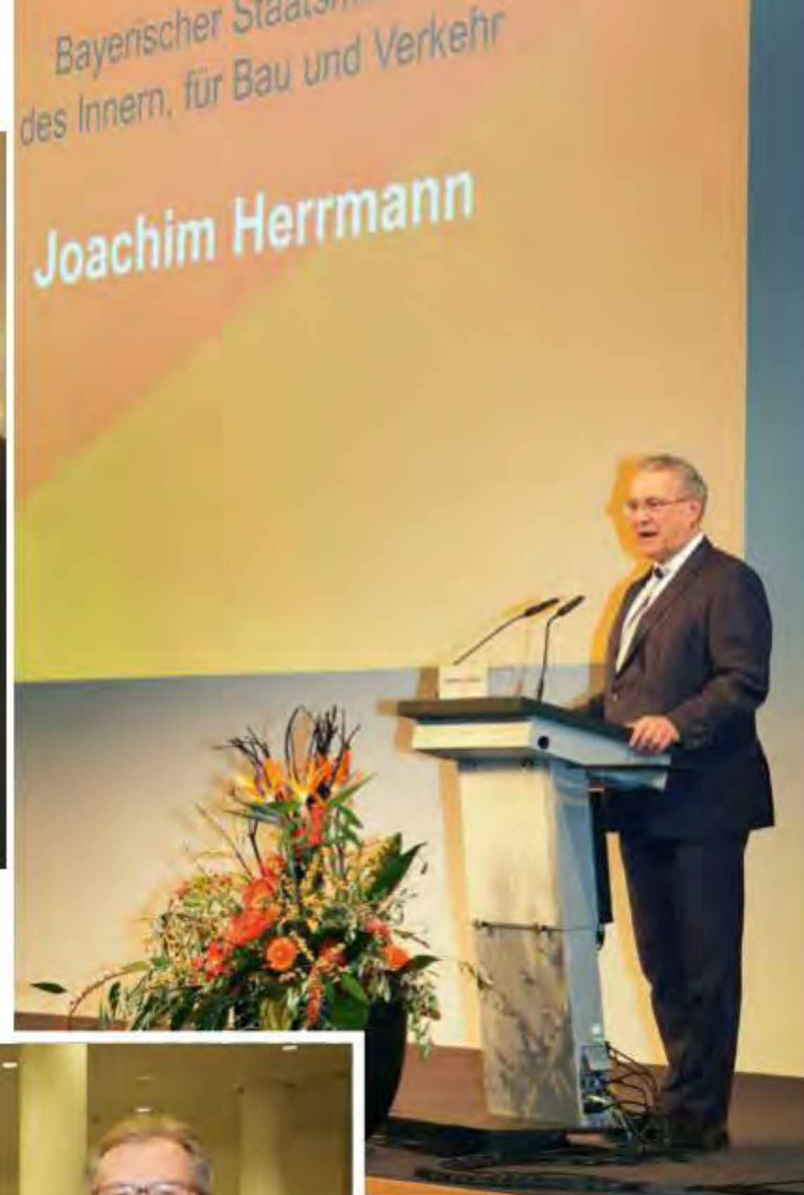
Innenminister Joachim Herrmann war Schirmherr und lobte in seinem Grußwort dieses Event, wo es sich lohne, hinzugehen.