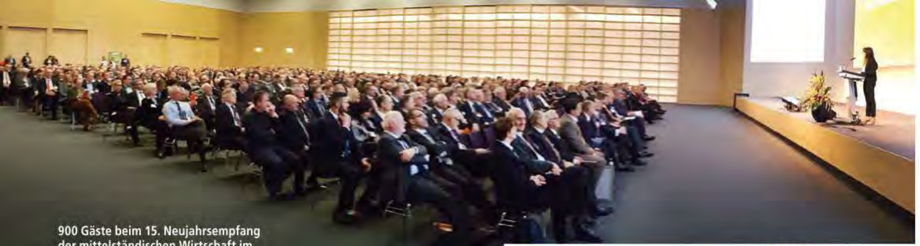
900 Gäste beim 15. Neujahrsempfang der mittelständischen Wirtschaft im NCC Ost der NürnbergMesse.